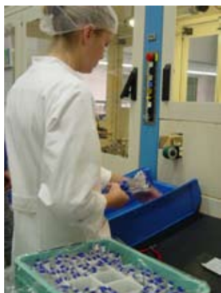
Aus dem Haus Dr. Best