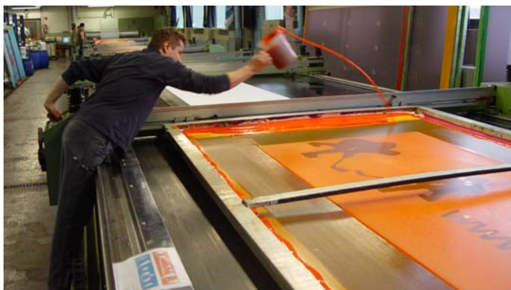
Fahnen Gärtner: Wenn die bunten Fahnen wehen

des privaten Wohnhauses nach der Belebung nicht mehr schwarzbraun, schlammig und schmierig ist, sondern glasklar bleibt, warum soll dies nicht auch im Kühlwasser der Firma ISOSPORT , dem weltgrößten Hersteller von Belegen für Schi und Snowboards funktionieren? Oder beim Lastwagenhersteller Daimler Chrysler.