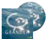
DVD: GRANDER Erfahrungen

Kostenlos anfordern: www.grandervertrieb.com