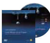
Filmdoku auf DVD: Unser Wissen ist ein Tropfen. Wasser, das unbekannte Wesen

Namhafte, weltweit agierende Industriebetriebe setzen auf die Grander Wasserbelebung.