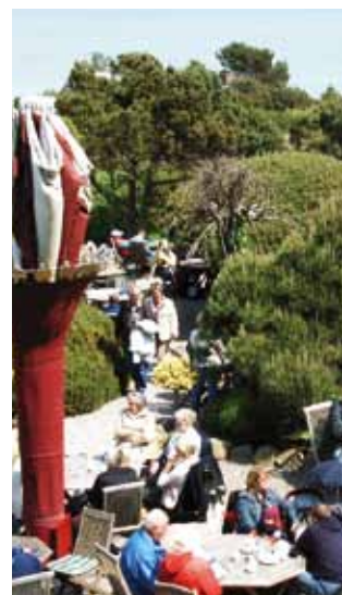
Kupferkanne Sylt - ein Ort der Ruhe und des Genießens

Hoch oben im Norden, eingebettet in eine bezaubernde Kiefernlandschaft mit Blick auf das Sylter Wattenmeer steht die Kupferkanne in Kampen. Sie stellt seit Generationen ein einzigartiges Refugium für ihre Gäste dar. Die Luft ist erfüllt vom Duft des frisch gerösteten Kaffees und der leckeren Kuchen. Fernab vom Trubel der beliebten Nordseeinsel, beinahe versteckt gelegen, bietet die Kupferkanne einen Ort der Ruhe und des Genießens. Ob Sie hier mit einem opulenten Frühstück in der Frühjahrs-sonne Ihren Tag beginnen, im Hochsommer einen der begehrten Schattenplätze unter den imposanten Schirmen ergattern oder in den Wintermonaten am Kaminfeuer bei einem heißen Tee ein gutes Buch lesen – die