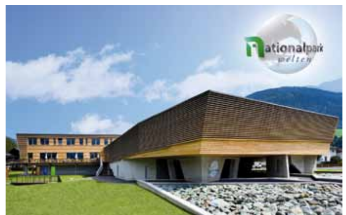
Nationalparkzentrum Hohe Tauern: auch architektonisch ein Juwel

Grund genug ein Fachevent über Grander inklusive Führung im Nationalparkzentrum durchzuführen. Branchenspezifische Einsatzmöglichkeiten und Nutzen des belebten Wassers sowie Erfahrungen von Experten und Anwendern stehen im Mittelpunkt der Veranstaltung. Die Einladung richtet