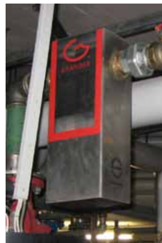
Interalpen-Hotel Tyrol: Der gesamte Heizwasserkreislauf ist belebt.

Heiz- und Kühlsystemen liefern beeindruckende Messergebnisse. Selbstverständlich kann jeder Anwender in den eigenen vier Wänden seine persönlichen Erfahrungen machen. Er wird nicht nur klares Wasser in der Heizleitung, sondern auch wohlige Wärme in den Wohnräumen feststellen. Als angenehmer Nebeneffekt senkt sich durch die verbesserte Wärmeübertragung meist auch der Energieverbrauch, da das intensivere Wärmeempfinden oft eine Senkung der Heizwasser- und Raumtemperatur zur Folge hat.