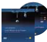
Film doku auf DVD: Unser Wissen ist ein Tropfen. Wasser, das unbekannte Wesen