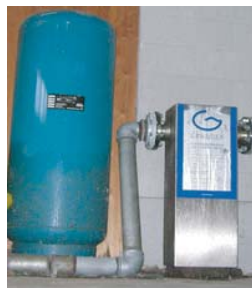
GRANDER enhed placeret umiddelbart efter pumpestation hos DYKON A/S

Når råfjerene er vasket, tørretumbles de ved hjælp af et højt damptryk for samtidig at skille fjerene ad og vandet der recirkulerer i damp tørreprocessen har indtil nu været meget okkerrødt.